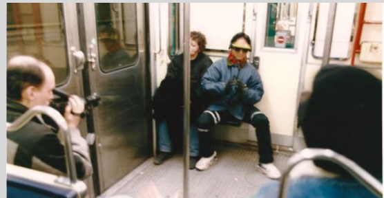
Tournage en Hi8 dans le métro Miserere (1995)