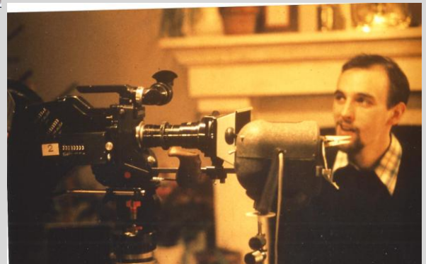
Caméra 16mm Aaton louée pour Veillée de Noël (1983)