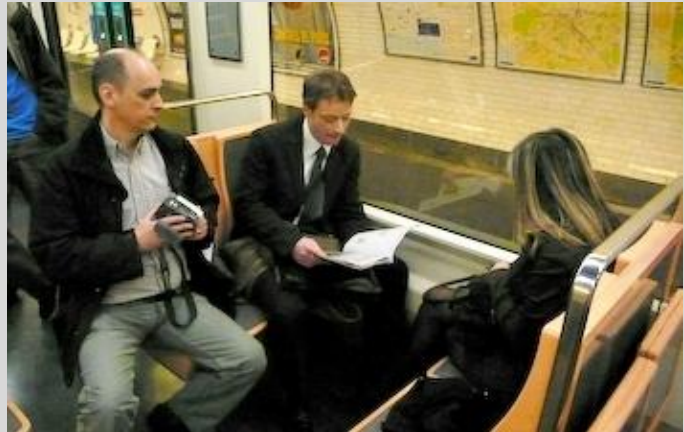
Dans le métro, tournage en DV de Je voudrais pas crever... (2008)

Je ne sais pas. C'est important ? (rires) Non je déconne. Encore que... Bon attendez, je regarde... une Sony HDR-CX740, bon, voilà. Un milieu de gamme HD assez quelconque, je crois, achetée 1200 euros en 2012. J'ai dû emprunter celle de Pierre Orcel pour un film, je ne sais plus lequel, parce qu'elle a un branchement XLR que je n'ai pas sur la mienne. Mais maintenant, Pierre prend pour chaque film le son avec un magnétophone numérique type Zoom. Je ne suis pas tellement fétichiste du matos, je n'y comprends pas grand chose, je préfère bien m'entourer. Je dis parfois : "Donne une caméra pourrie à Scorsese, il te fera un film génial, donne une Red 4K machin-truc à mon beau-frère, ça restera de la daube". C'est pour ça que j'étais longtemps fan du Dogme 95 de Lars von Trier. On se réfugie toujours trop derrière la technique, et on néglige la mise en scène et les comédiens, surtout chez les amateurs.