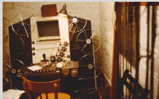
La table de montage Atlas du premier 16mm, Veillée de Noël (1983)