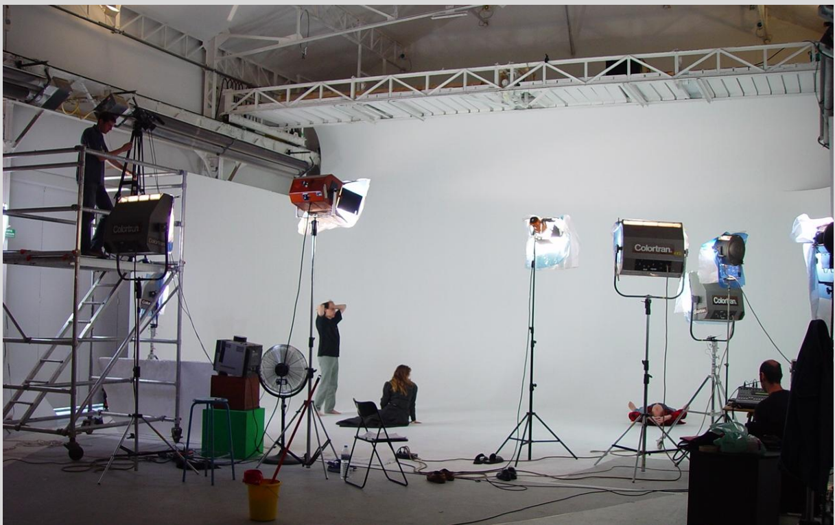
La nuit des temps (2003) : pour une fois, un déploiement matériel important

Concernant le clin d'œil à L'origine du monde de Courbet, c'est finalement très anecdotique. D'ailleurs, j'ai supprimé cette scène pour ma version courte, qui me permet de proposer le film pour les festivals de films de moins de 15 minutes.