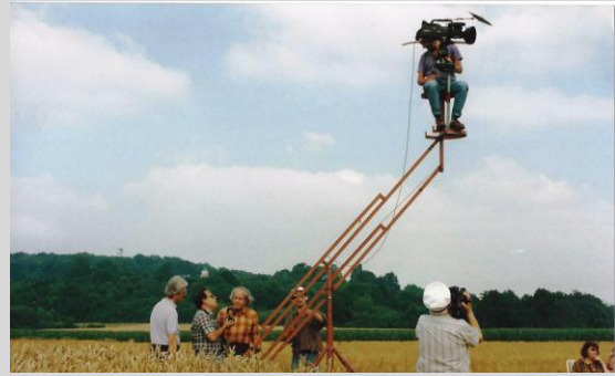
Grue artisanale pour La simplicité des choses (1993)

La MdF devrait constituer un lien privilégié du monde amateur de la FFCV avec celui des professionnels, mais il y a beaucoup de frilosité, voire du rejet de la part de certains adhérents de la FFCV, et c'est bien dommage. Les amateurs sont nombreux à se contenter de ce qu'ils font dans leur coin, et ne cherchent pas à progresser sous prétexte que "c'est un loisir". Ils en ont parfaitement le droit, mais ce sont ceux là qui rouspètent quand ils n'ont pas eu de prix au concours régional, sans prendre le risque de proposer leur film dans d'autres festivals ou de se frotter à une critique plus argumentée.