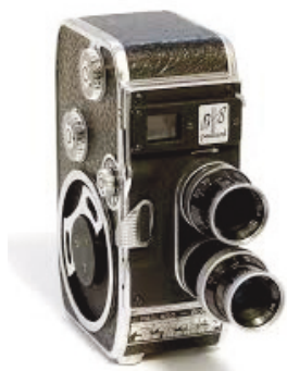
Caméra Bolex Paillard 8 mm

même après 65 ans ! Entre-temps, Berthiot sort son Pancinor (Zoom chez Angénieux, nom français qui a lui aussi perduré), objectif à focale variable (trois fois). Pour le diaphragme, un posemètre, petite boîte de la taille d'un paquet de cigarettes, nous donne la bonne ouverture (ou presque) à reporter manuellement sur l'objectif.