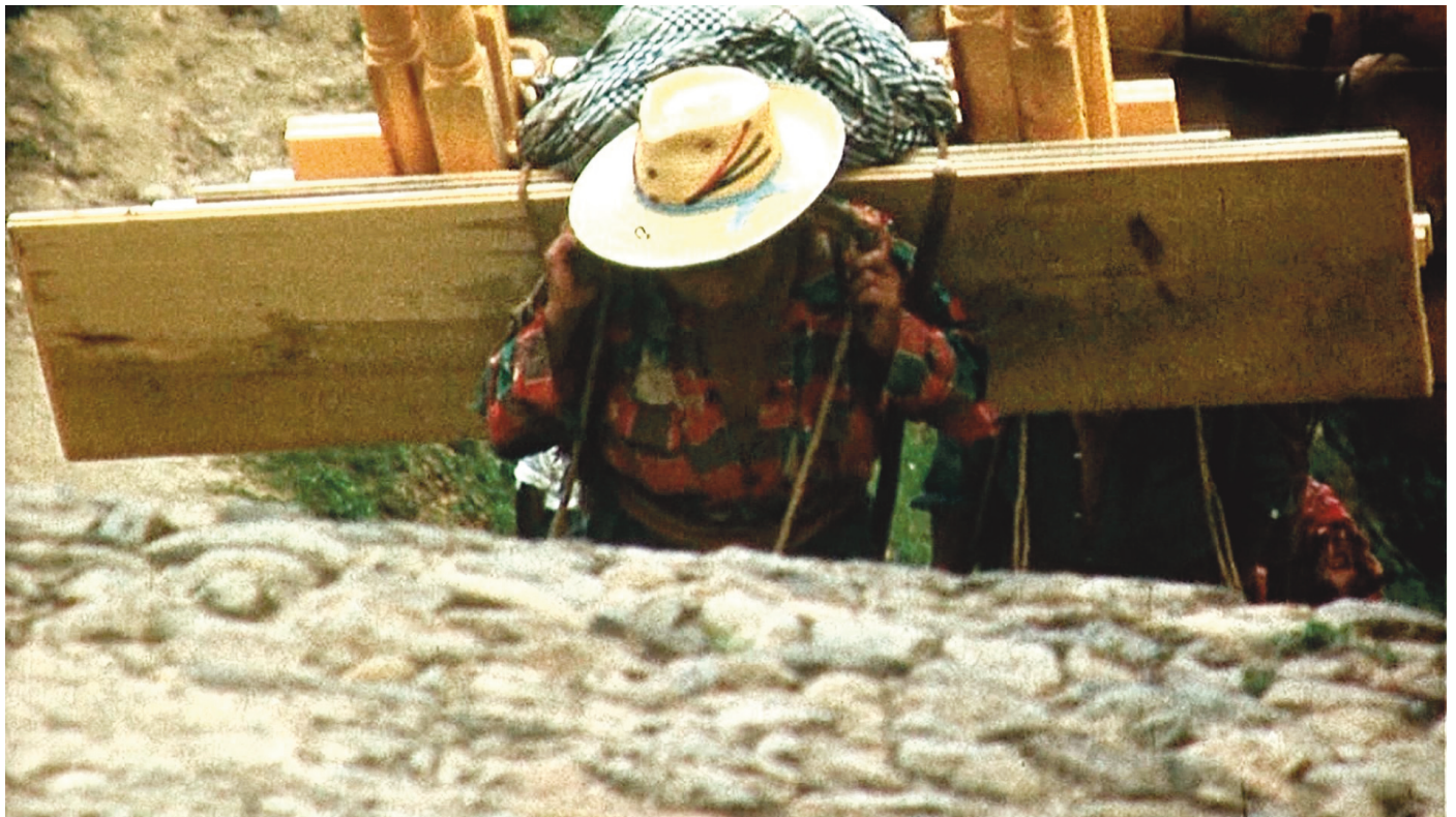
Le Christ vers le Golgotha ? Non : un marchand ambulant vers Chichicastenango.