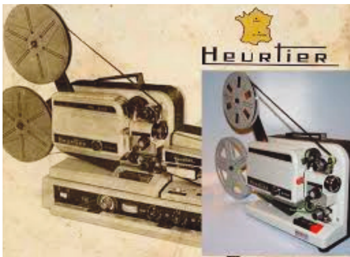
Le projecteur Heurtier 8 mm permet la sonorisation des films.

colle (pas trop non plus), fermer un volet presseur et attendre une à deux minutes que ça sèche. A la projection, il arrive que l'image sautille à certains collages, ou pire il y a rupture. C'est très artisanal !