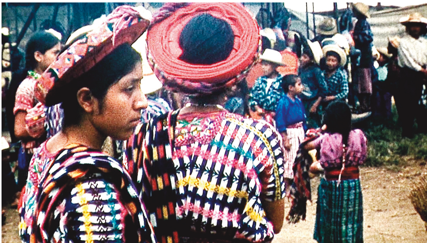
Au Guatemala, zéro touriste en 1960, « une population aux vêtements colorés respectueuse des coutumes ». Hautes et basses terres du Guatemala.

il est relié par un fil à une grande caméra de 400 grammes “vide” avec seulement une optique. Le viseur est en noir-et-blanc. Le tout est très lourd et encombrant. Le fil qui traîne n'est jamais où on le pense ! Extatique, je filme l'Islande. N'ayant pas de téléviseur avec moi, je ne vois le résultat en grand et en couleurs qu'à la maison. L'Islande qui, à part la lave, n'est pas vraiment un pays aux couleurs vives, ne sort pas valorisée de l'expérience. Les rouges, les bleus rutilants des fleurs en plastique (à l'époque, il n'y en a pas d'autres) bavent à qui mieux mieux. J'ai la chance qu'une maison des jeunes me rachète le tout à un bon prix. Calmé, j'attends.