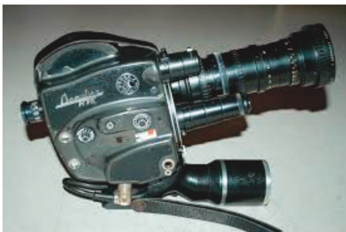
La caméra Beaulieu 16 mm, avec zoom Angénieux.

Je passe donc au 16 mm, tout autre chose, qualité de l'image, la taille du film facilite le montage. J'achète une Paillard 16 mm à tourelle trois objectifs qui me sera volée au Maroc. Puis une Beaulieu (française) à manivelle, trois objectifs aussi, également volée, mais