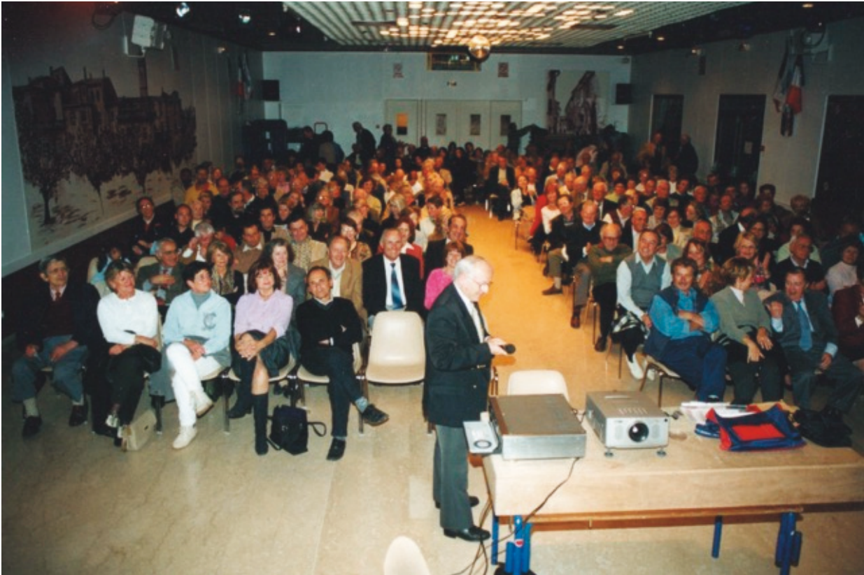
Projection sur le Yemen, à Mougins en 2012, devant 200 spectateurs.