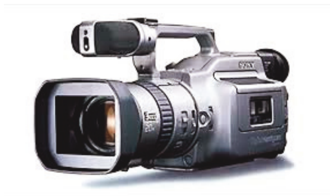
La caméra DV Sony VX1000 : « la meilleure ! »

(initialement publié dans L'Écran de la FFCV n°113)