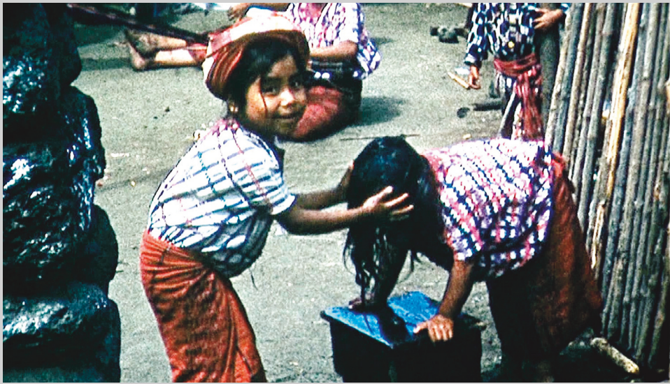
Hautes et basses terres du Guatemala.