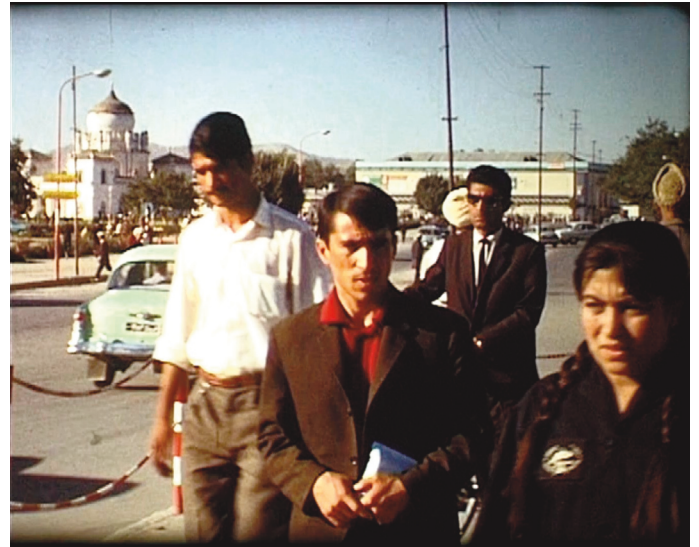
Dans une rue de Kaboul, en 1957. L'Afghanistan, avant.

En 1957, premier grand voyage, deux mois en Inde et au Népal. Au retour, les projections, publiques, avec un gros projecteur Heurtier, français aussi, remportent, via le ciné-club bisontin, un grand succès. Nous sommes obligés de faire plusieurs séances