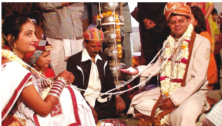
Un Mariage au Gujrat (Inde, 2008)