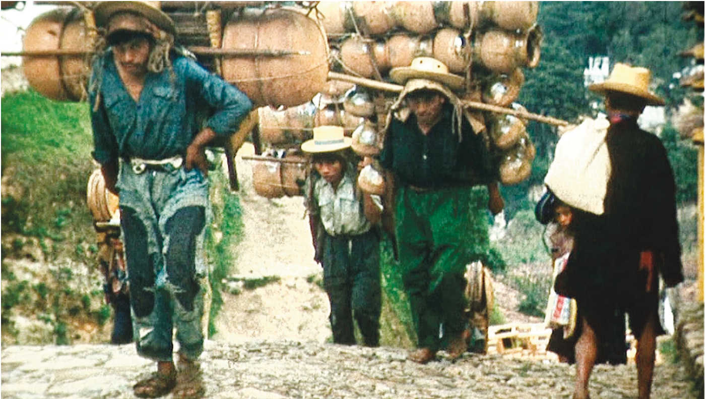
Hautes et basses terres du Guatemala.