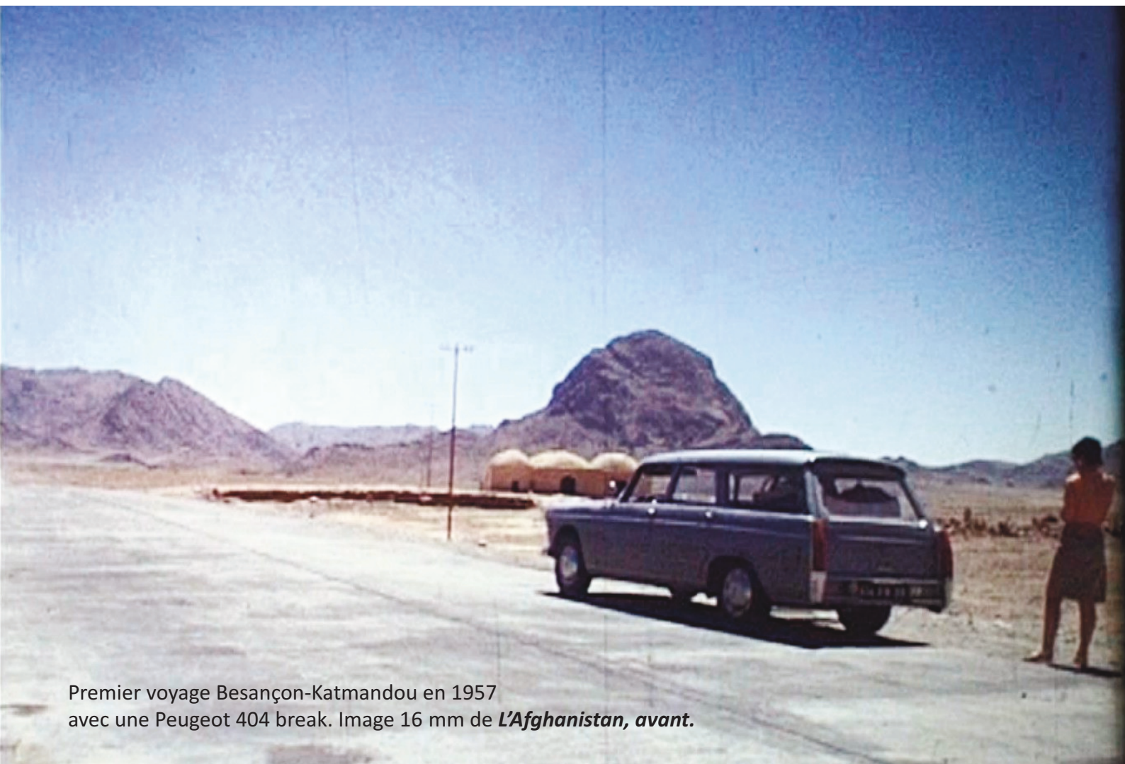
Premier voyage Besançon-Katmandou en 1957 avec une Peugeot 404 break. Image 16 mm de L'Afghanistan, avant .

T reize voyages en Inde dont sept en voiture depuis la France, cinq traversées du Sahara pour relier Le Cap toujours par la route, un périple de 32 000 km depuis New-York jusqu'au plus profond de l'Amérique Centrale en 1960 : notre cinéaste cannois a découvert des contrées où il fut l'un des tous premiers touristes. A 92 ans, avec son épouse Claudine, il aura traversé 114 pays qu'il a passionnément filmé... avec des dizaines de caméras, du 8 mm argentique jusqu'à la plus récente vidéo HD. Auteur d'une filmographie exceptionnelle où l'on ne compte plus les pépites, Jean-Jacques Quenouille est sans contexte un auteur majeur de la FFCV. Après avoir confié à la cinémathèque de la FFCV un disque dur de 250 films, il était grand temps d'accorder à notre élégant baroudeur un numéro spécial de L'Ecran .