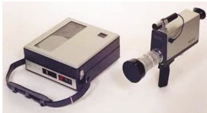
Le premier caméscope grand public : le Sony VHS Videoportapak.

Je renonce au 16 mm vers la fin des années 1970, pour raison financière. Étant donné le coût exorbitant des bobines Kodachrome de 30 mètres, soit trois minutes d'enregistrement, le film revient plus cher que le voyage.